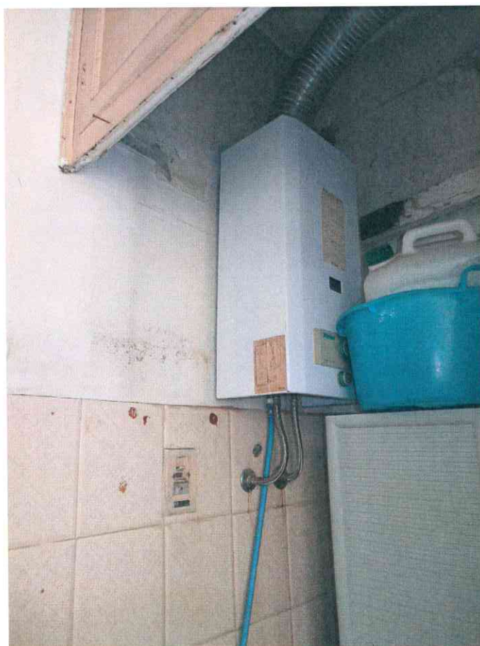
FO - 10 - CALDAIA