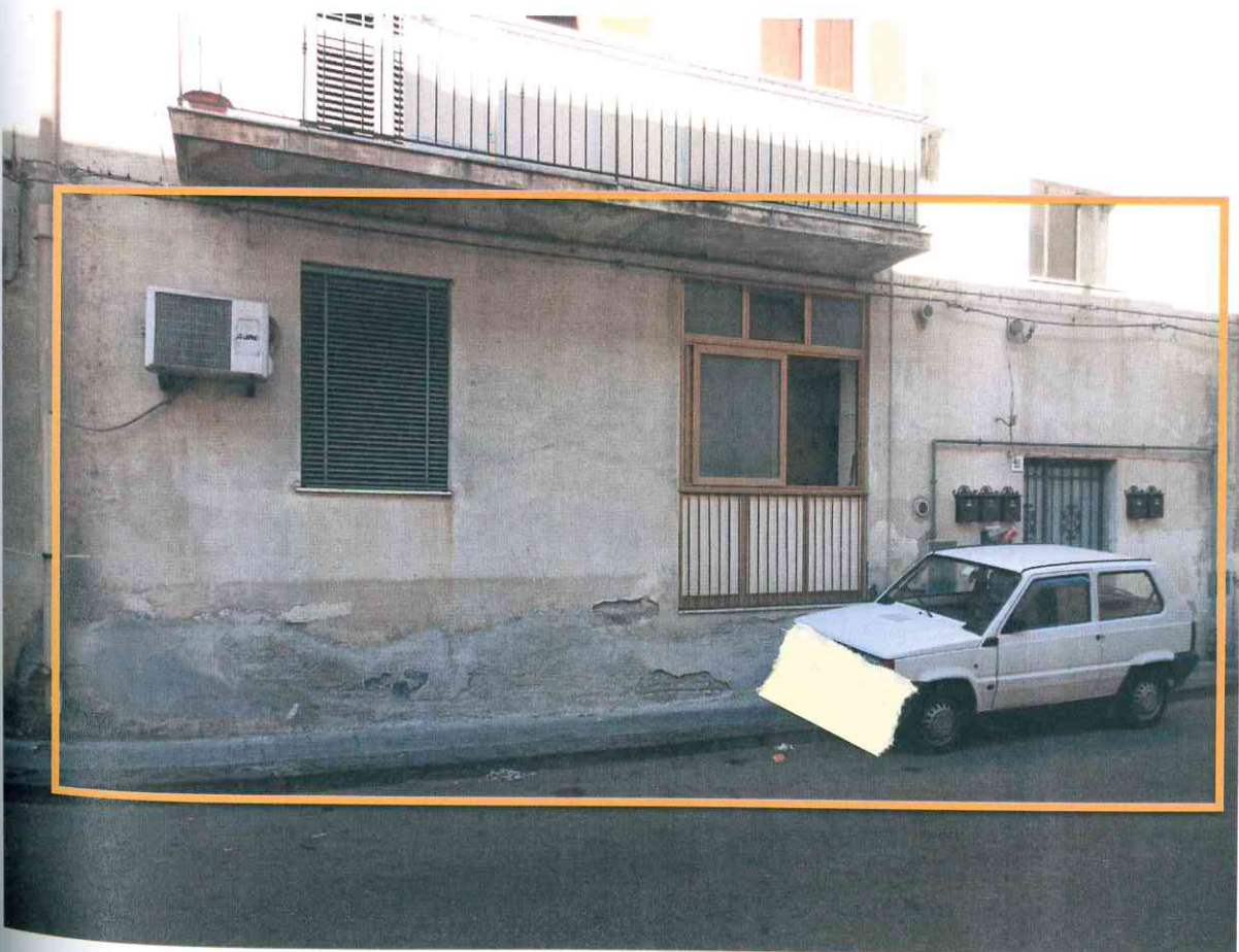
FO - 2 - PROSPETTO SU VIA GRAVINA