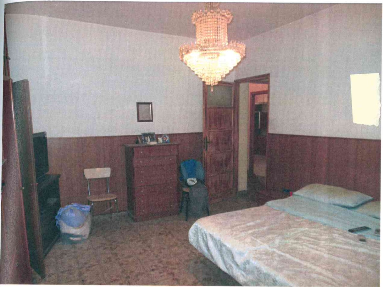
FO - 11 - CAMERA DA LETTO