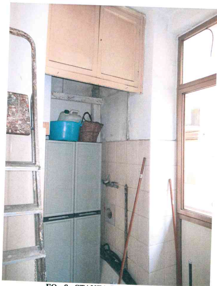
FO - 8 - STANZA-LAVANDERIA