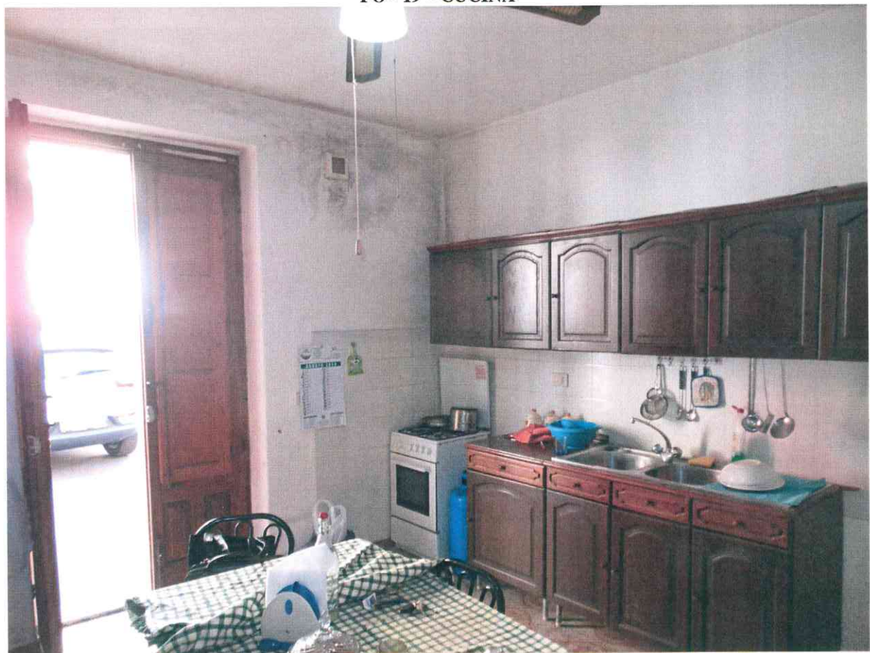
FO - 20 - CUCINA