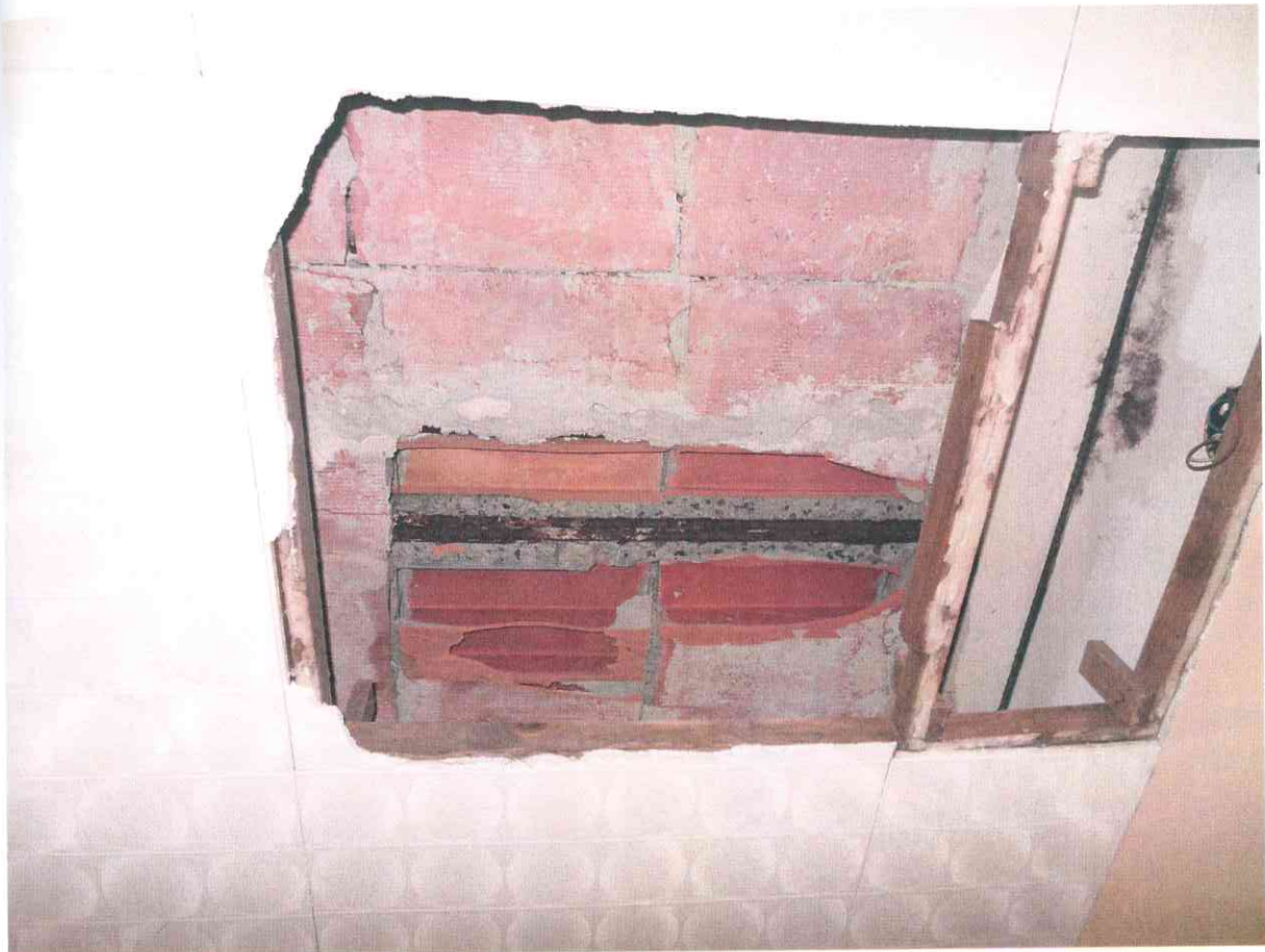
FO - 17 - SOFFITTO BAGNO