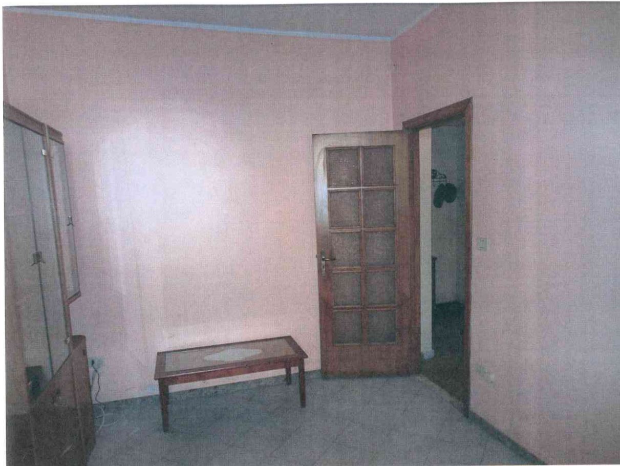
FO - 13 - SALOTTO