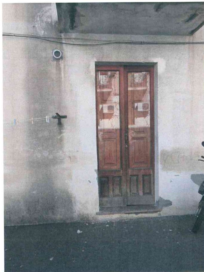
FO - 21 - INGRESSO LATO CORTILE