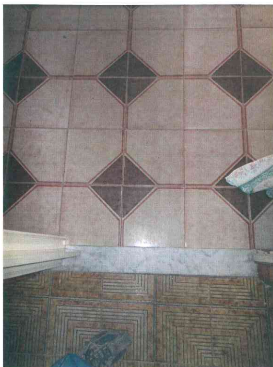
FO - 24 - PARTICOLARE PAVIMENTO