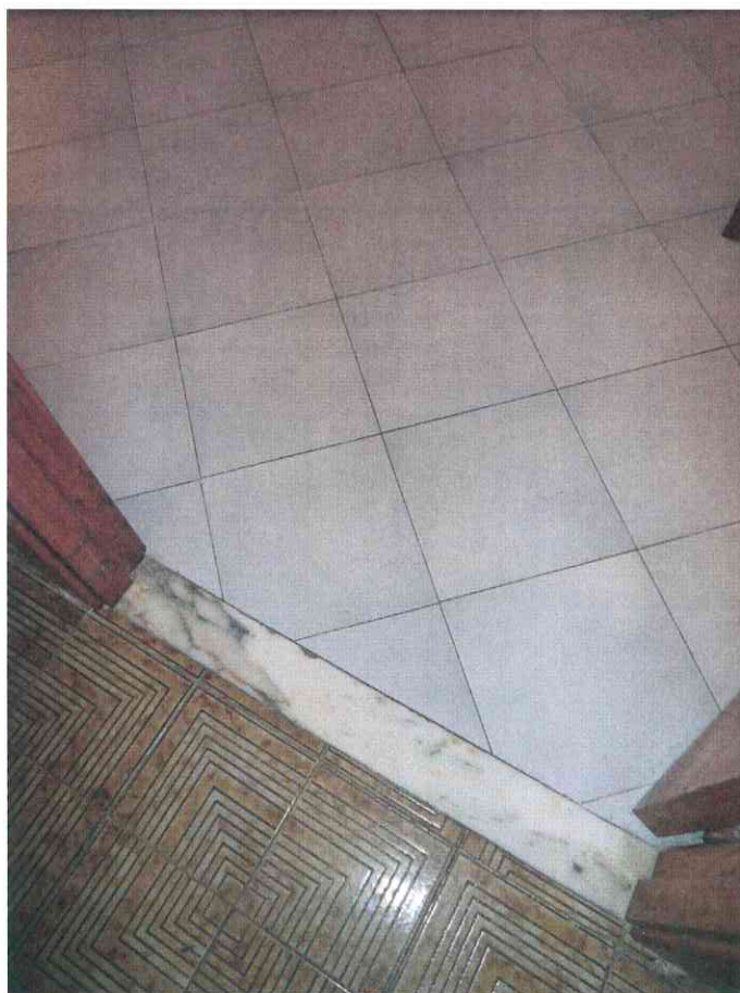
FO - 25 - PARTICOLARE PAVIMENTO