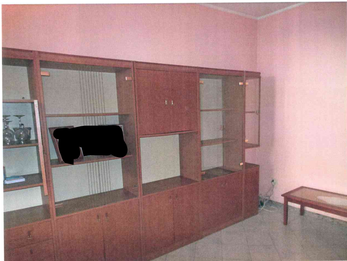
FO - 14 - SALOTTO