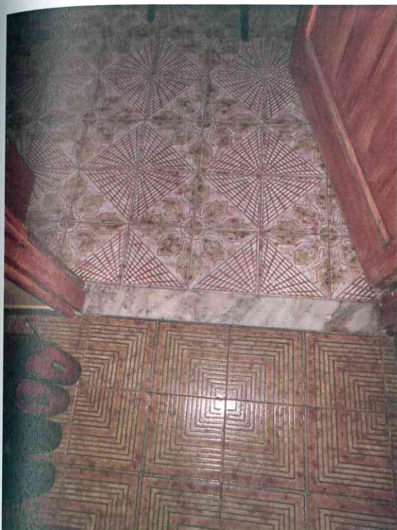
FO - 23 - PARTICOLARE PAVIMENTO