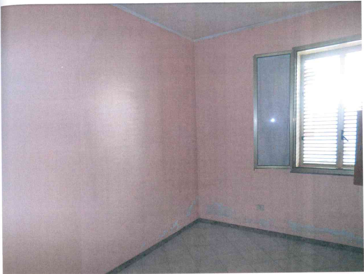
FO - 15 - SALOTTO