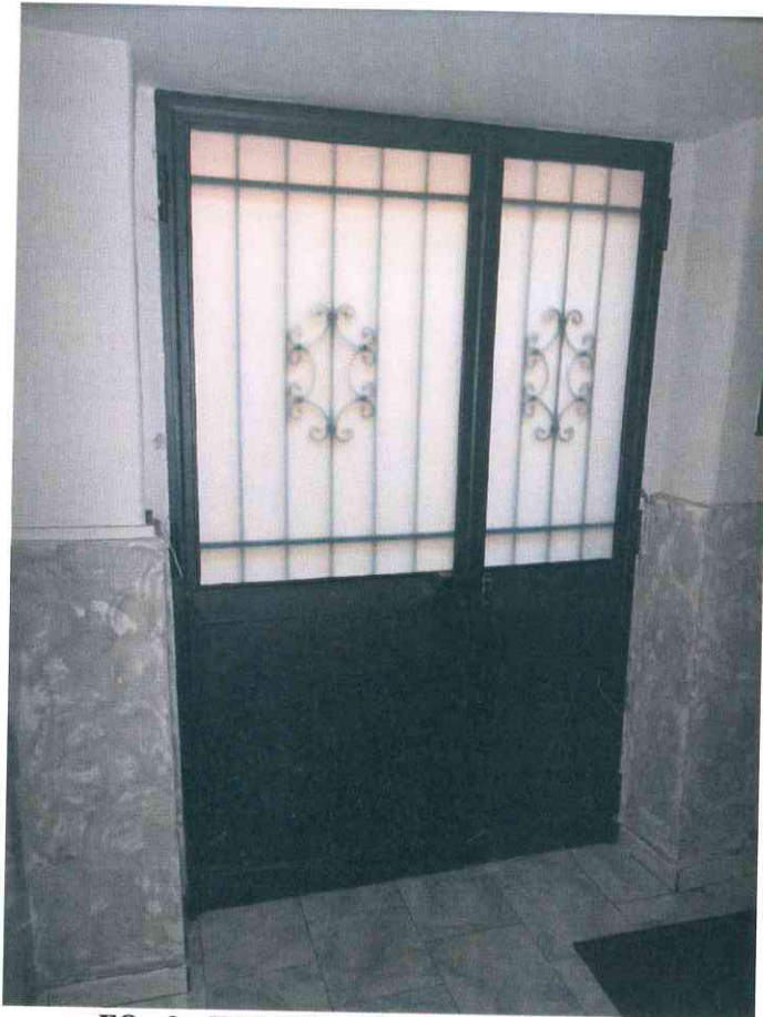
FO - 3 - INTERNO PORTONE INGRESSO