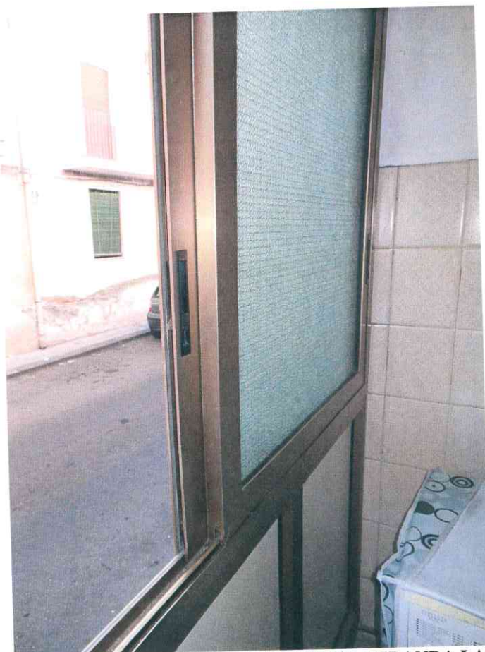
FO - 27 – PARTICOLARE INFISSO IN ALLUMINIO VERANDA LAVANDERIA