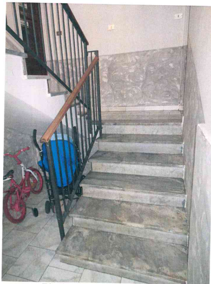
FO - 4 - SCALA CONDOMINIALE