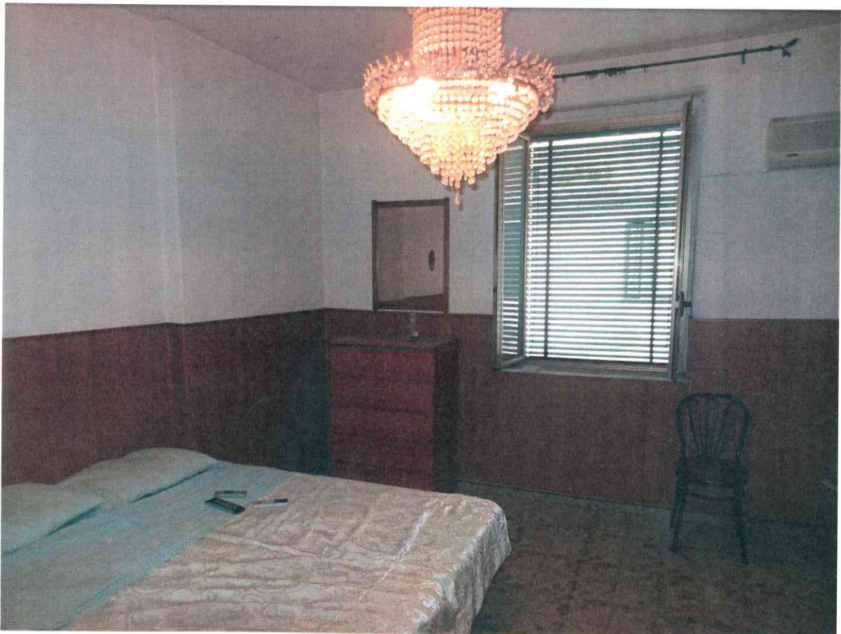
FO - 12 CAMERA DA LETTO