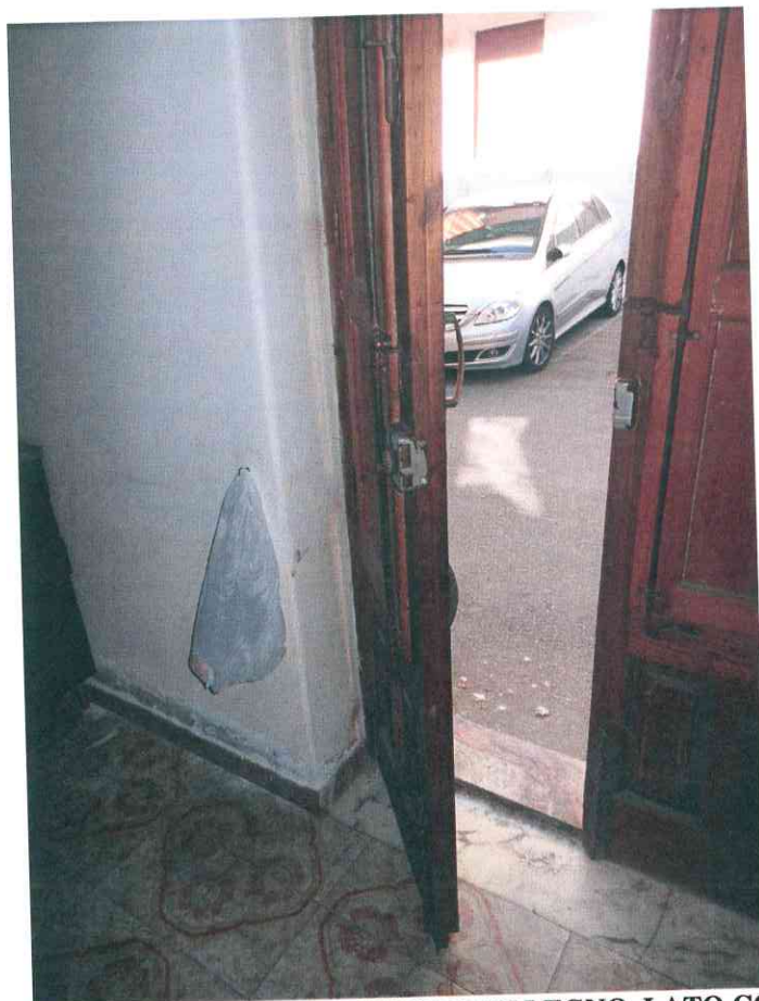
FO - 26 – PARTICOLARE PORTONCINO IN LEGNO LATO CORTILE