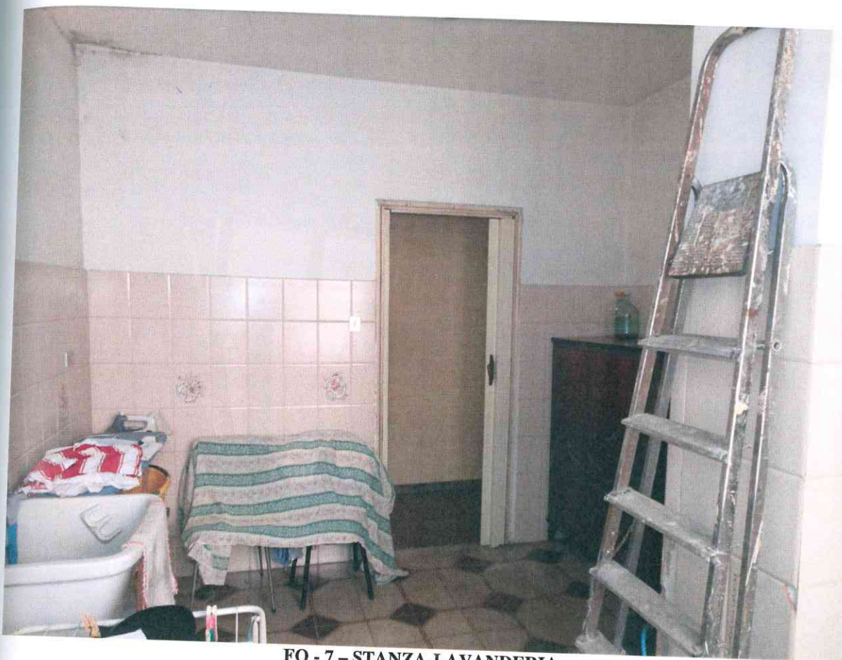
FO - 7 - STANZA-LAVANDERIA