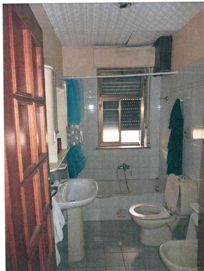
FO - 16 - BAGNO