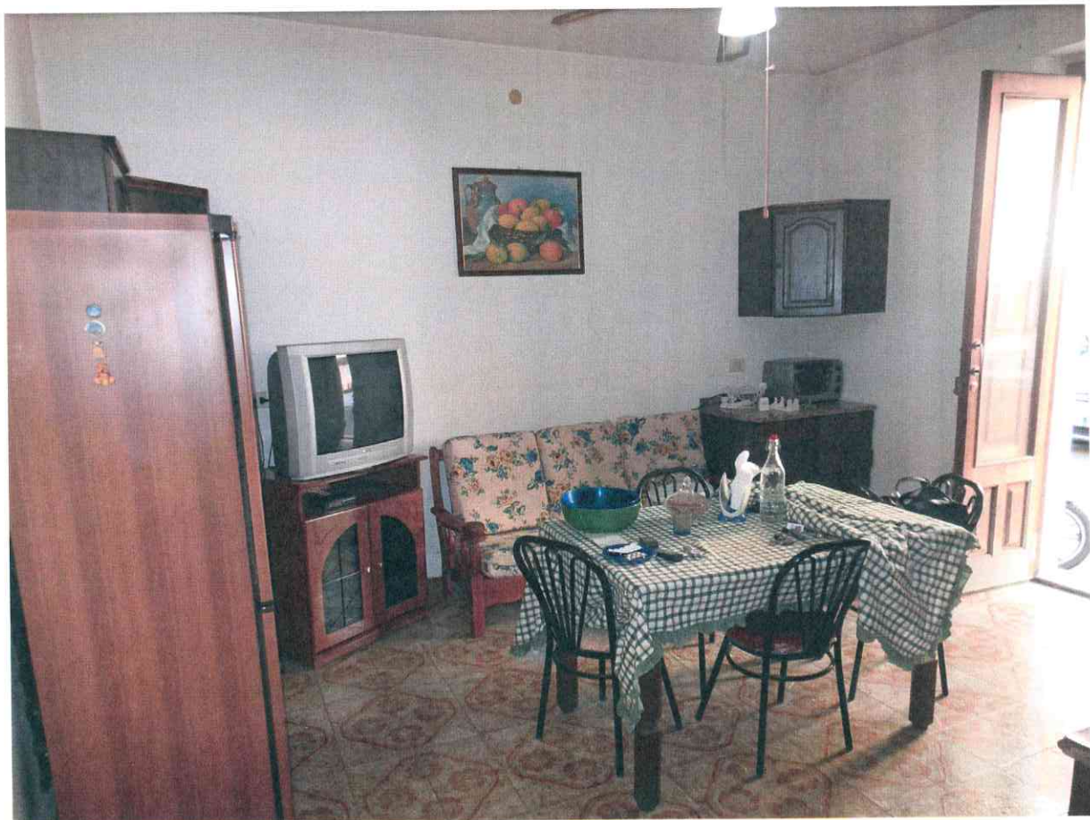
FO - 18 - CUCINA