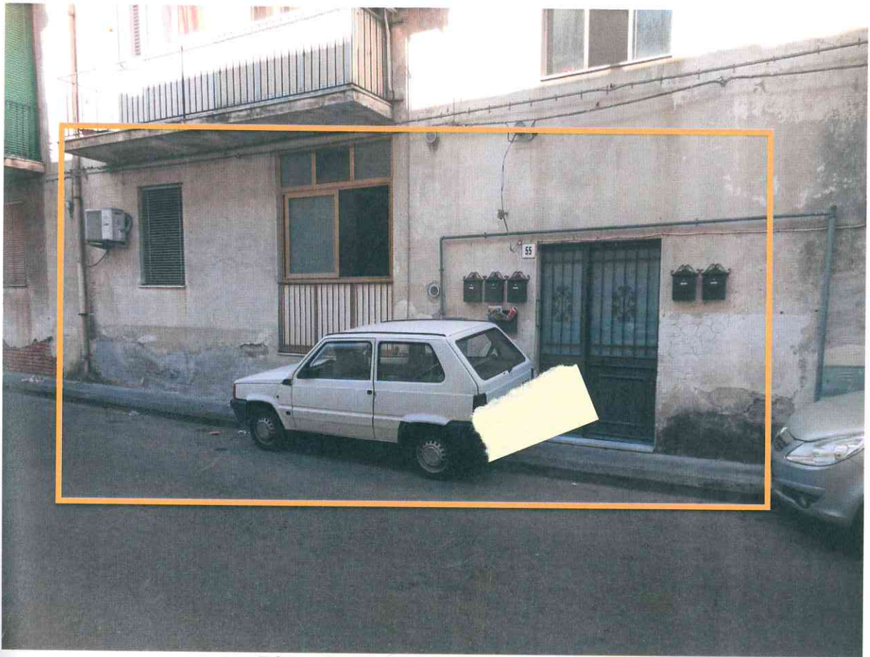
FO-1- INGRESSO LATO VIA GRAVINA