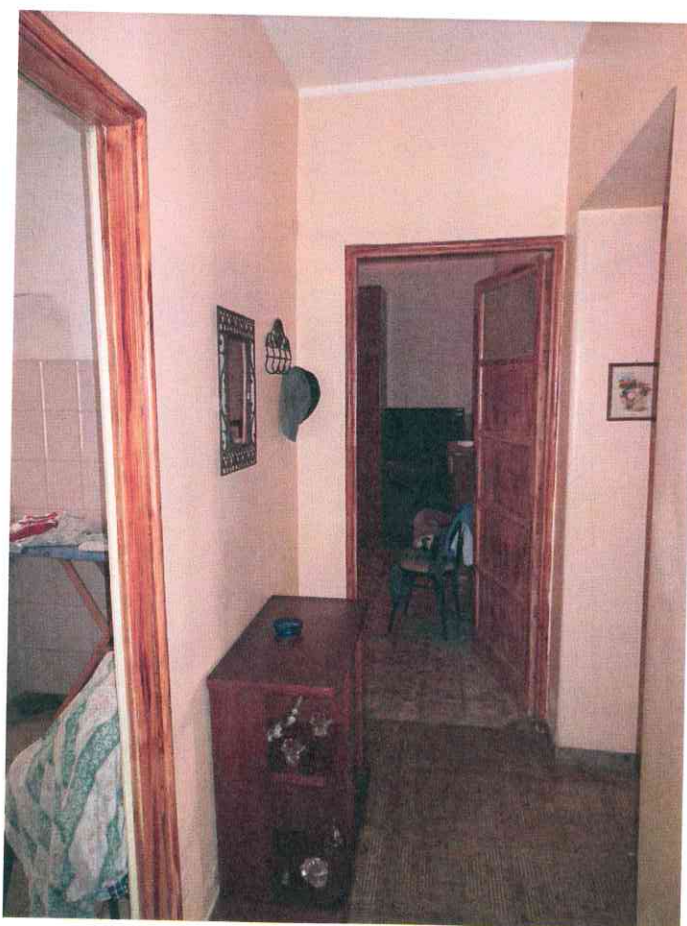
FO - 6 - DISIMPEGNO