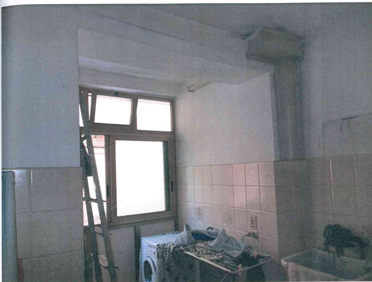
FO - 9 - STANZA-LAVANDERIA