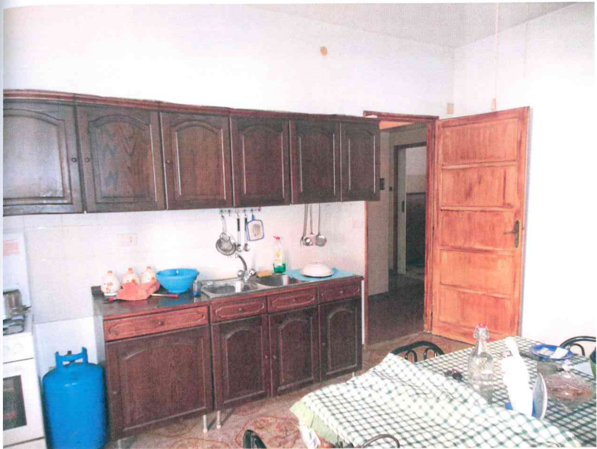
FO - 19 - CUCINA